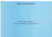
Tabella scaricabile in formato csv degli abitanti di Rigolato al 31 dicembre 1812,...

Demografia storica Adelchi Puschiasis 13110